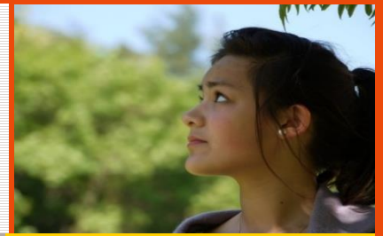
BISDOM DEN BOSCH

Laat jezelf als levende stenen voegen in de bouw van de geestelijke tempel